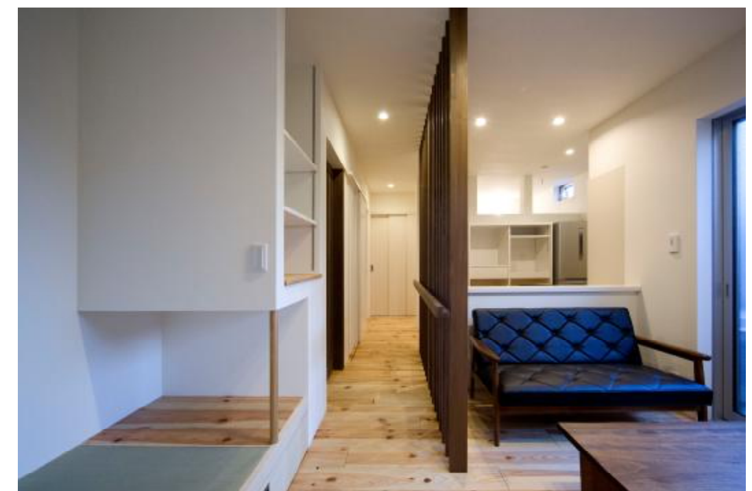
1階リビングからキッチンを見る