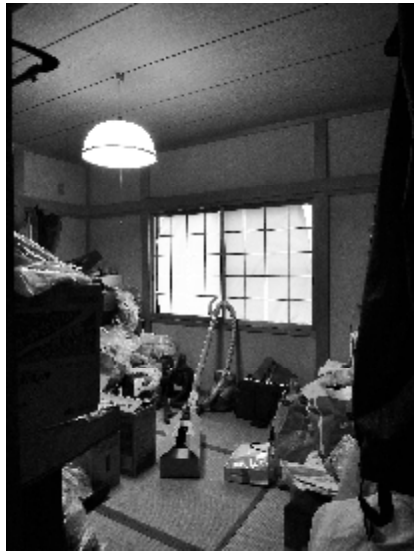
2階階段から和室を見る