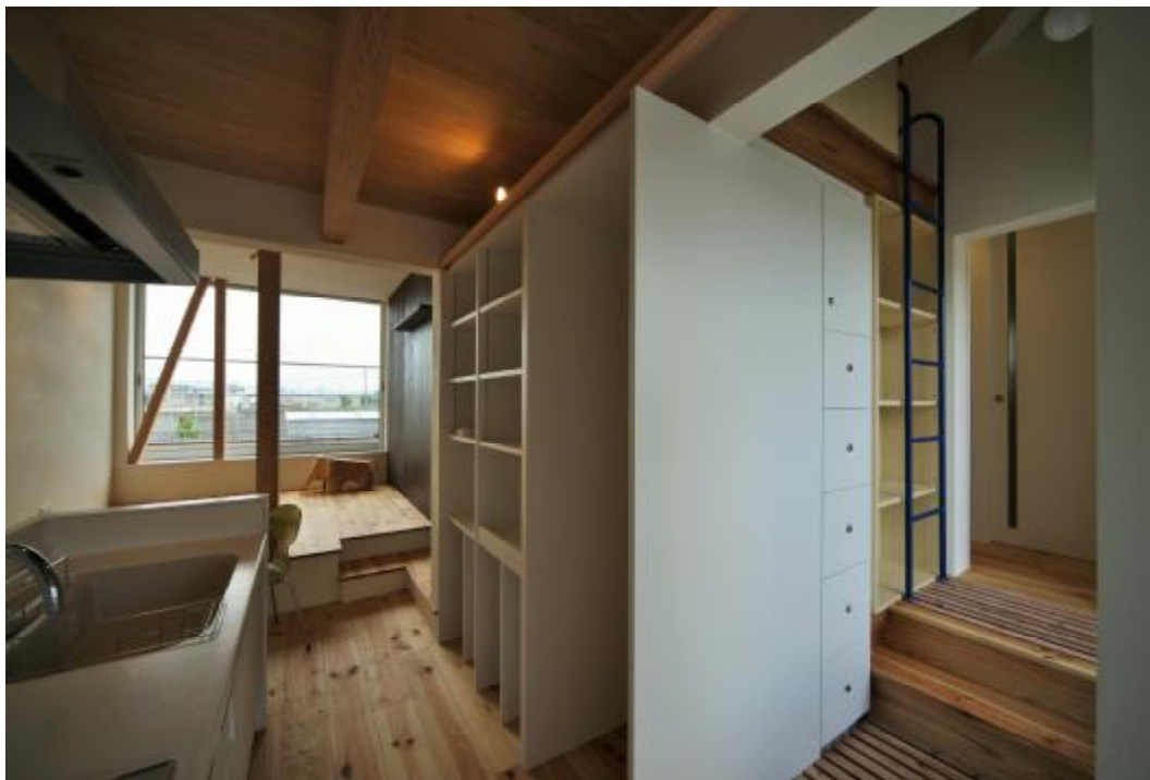
2階キッチンからリビングを見る