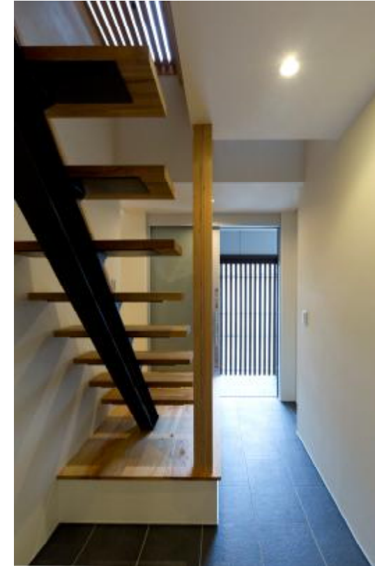
ホールから玄関を見る