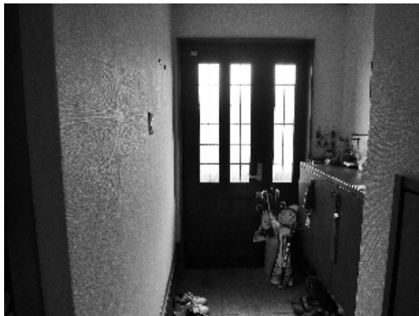
ホールから玄関を見る