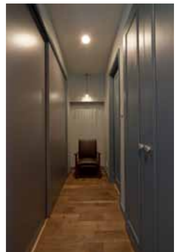
廊下とクローゼット