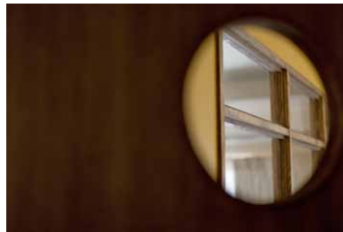
デザインドアからの眺め