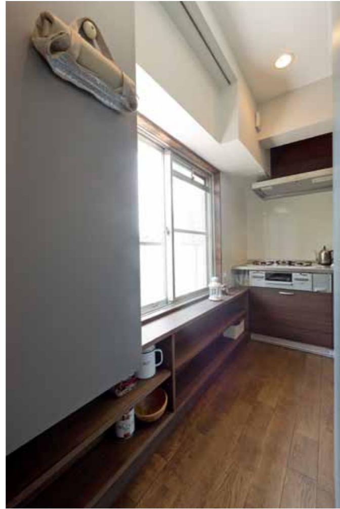
パントリー キッチン